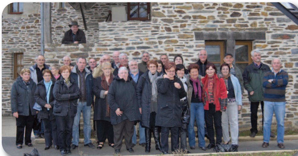
Le Conseil d'administration entouré de la sympathique équipe Saint-Laurent 2010 de Saint-Laurent-sur-Oust