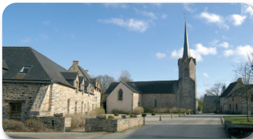
Longère paysanne et l'Église paroissial du XVI ème siècle

De 1894 à 1900, le conseil municipal de Saint-Laurent retarde la construction de son école publique, imposée par les lois de la III ème République. Après un échange de courrier avec le préfet, finalement sous la contrainte, l'école et le logement de l'instituteur sont construits en 1901. Après la fermeture de l'école pendant la Seconde