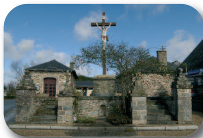
La mairie et le calvaire

La croix est posée sur un piédestal maçonné de palis de schiste et de pierres de taille de poudingue rouge, refait en 1887. Le fût rond, orné dans sa partie haute de trois moulures, la fait dominer le « champ de morts ». La croix en granit, ancienne, est écornée mais laisse apparaître sa découpe qui la rapproche du dessin de la croix de Malte, dite Templière. On ignore si elle a un rapport avec une des nombreuses dépendances de la commanderie de cet ordre à Carentoir, non loin de là ( INS M.H. 1925 ).