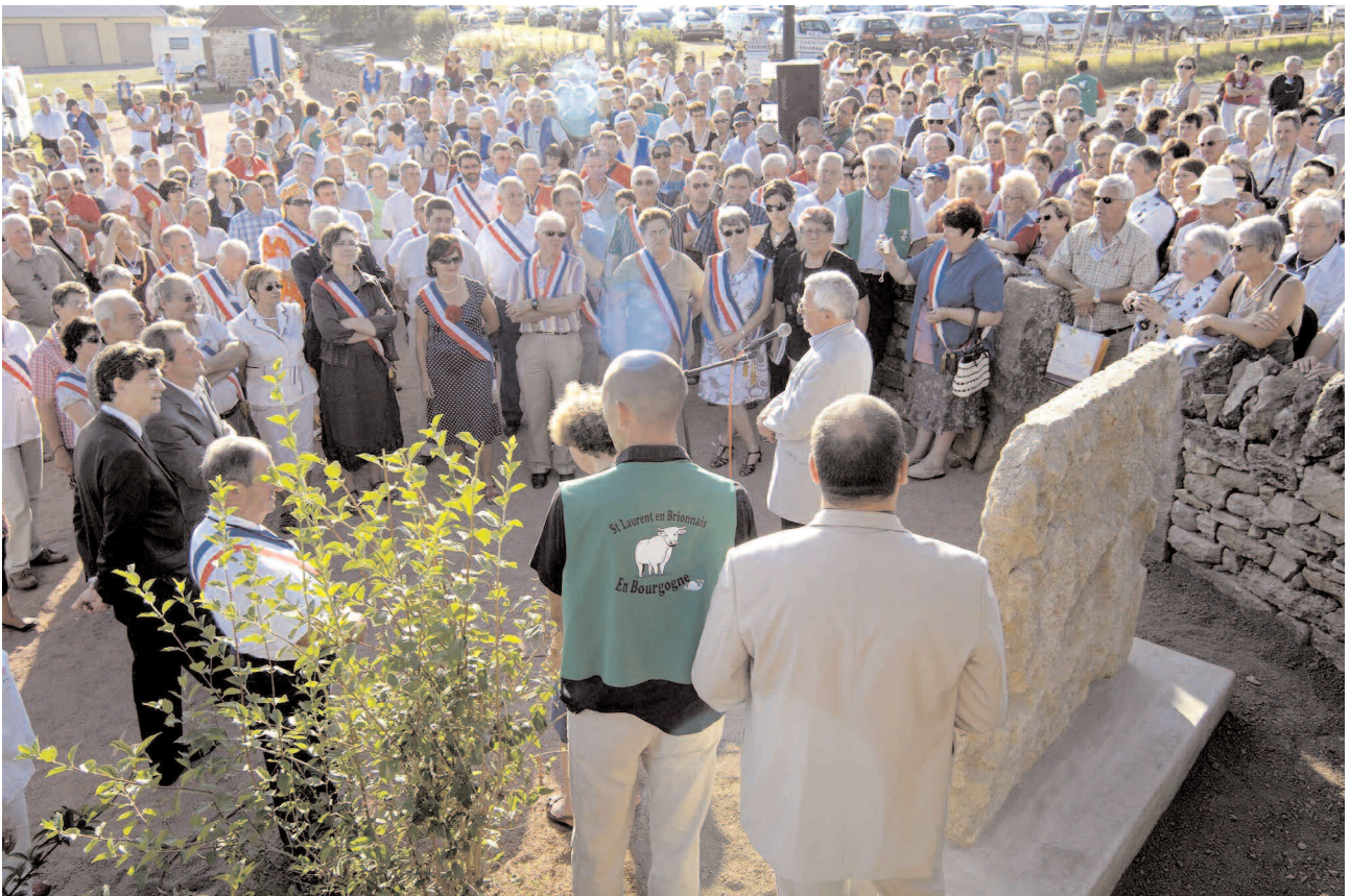
Les élus, les personnalités locales et les délégations lors de l'inauguration de la stèle le 4 juillet 2009

N° 32 - octobre 2009 www.saintlaurent.info