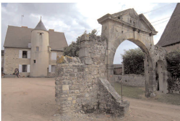
Belle maison ancienne avec porche daté de 1516

Un village s'est formé autour de l'église et de l'établissement clunisien de Saint-Laurent-Briennensis ou en Brionnois, dont on ne sait rien cependant, sinon qu'il a dû être un bourg important et prospère