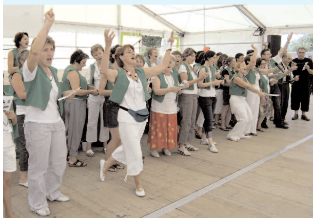
La joyeuse chorale en chauffeur de salle...

Dans notre village Autour du vieux clocher S'inscrivent dans l'paysage Nos haies, nos murs, nos prés, Si chacun pouvait Au moment de partir De notre Brionnais Garder un bon souvenir.