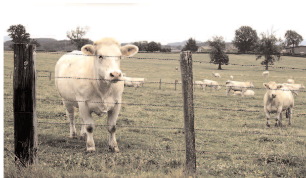
Bœufs blancs de la race charolaise

A perte de vue s'étendent de riches prairies verdoyantes où paissent tranquillement les bœufs blancs, car ici vous êtes dans le berceau de la race charolaise.