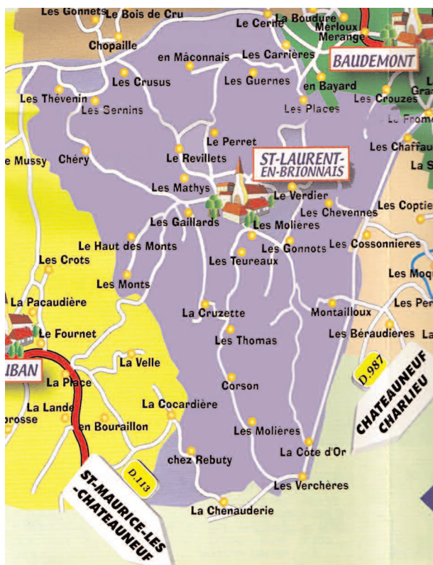
Commune de Saint-Laurent-en-Brionnais

Le climat est semi continental. L'hiver est souvent marqué par des journées ensoleillées et glaciales. Les étés peuvent être chauds, avec des pluies bien-faisantes. Hiver comme été, le ciel s'embrase au crépuscule de couleurs orangées qui illuminent les façades des églises et des vieux hôtels.