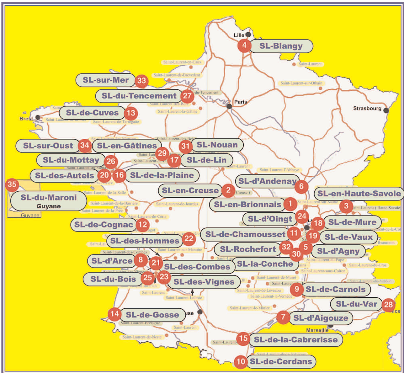
Etaient présents du nord au sud de la France et de la Guyane à Saint-Laurent-en-Brionnais