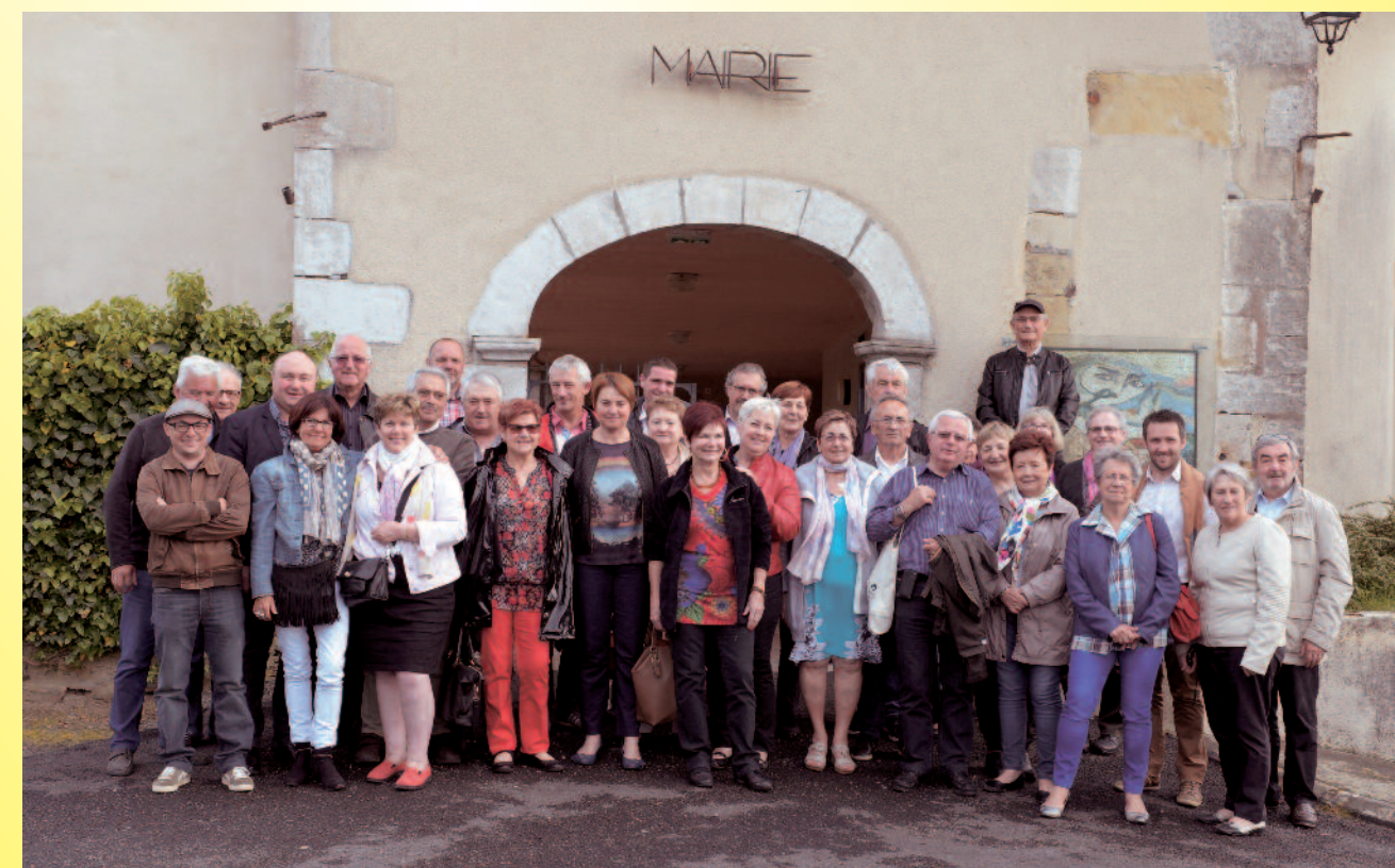
Les membres du conseil d'administration entourés des élus et des membres de l'association locale