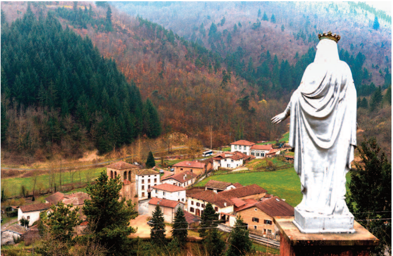
Saint-Laurent-Rochefort, vu de la colline qui surplombe le centre bourg