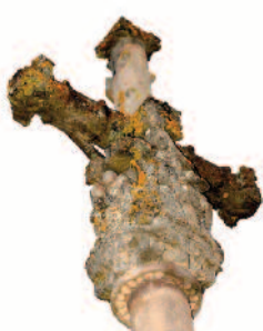
La croix du XVI e siècle

Ce n'est qu'à partir de 1817 que Saint-Laurent-Rochefort prend son nom officiel. Le territoire est traversé par des voies de communication anciennes sur la grande route d'Auvergne et présente de nombreux sites stratégiques propres à l'installation d'un habitat fortifié. Implantations gallo-romaines au Chira-Gros et à la Durrieuse, ainsi qu'au lieu-dit Solore, qui devient chef-lieu d'ager (territoire) du haut Moyen Âge (ager Solobrensis cité en 930). L'église de Saint-Laurent, commencée en 1470 a été terminée en 1496. L'autel principal en bois doré est d'une excellente sculpture. Sur la place de l'église, emplacement de l'ancien cimetière, se dresse une haute croix en grès, avec Piété, œuvre remarquable du XVIe siècle, inscrite sur l'inventaire des Monuments Historiques en date du 7 janvier 1926.