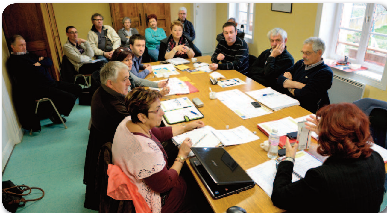
Les membres du CA et membres associés en réunion

Les 5 et 6 avril 2013 l'Association nationale des Saint-Laurent de France tenait son conseil d'administration à Saint-Laurent-Rochefort.