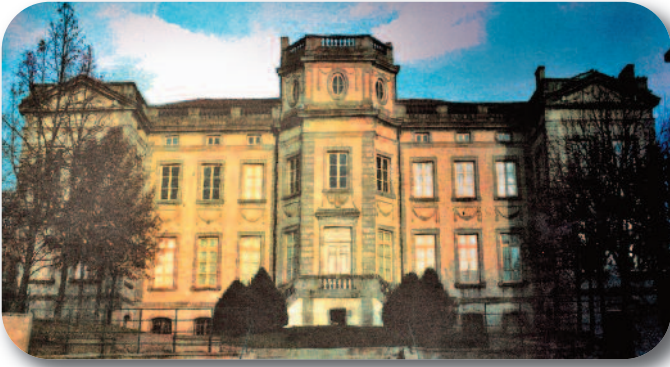
Château de Boën et son musée des Vignerons du Forez

Dans ce cadre, au cœur du vignoble des Côtes du Forez (AOP), un musée interactif des Vignerons du Forez est logé dans le château de Boën construit à la fin du XVIII e siècle par l'Italien Dal Gabbio. Ce musée invite petits et grands à découvrir le travail de la vigne et la vie quotidienne des vignerons grâce à des vidéos, des documents sonores, des maquettes et des jeux.