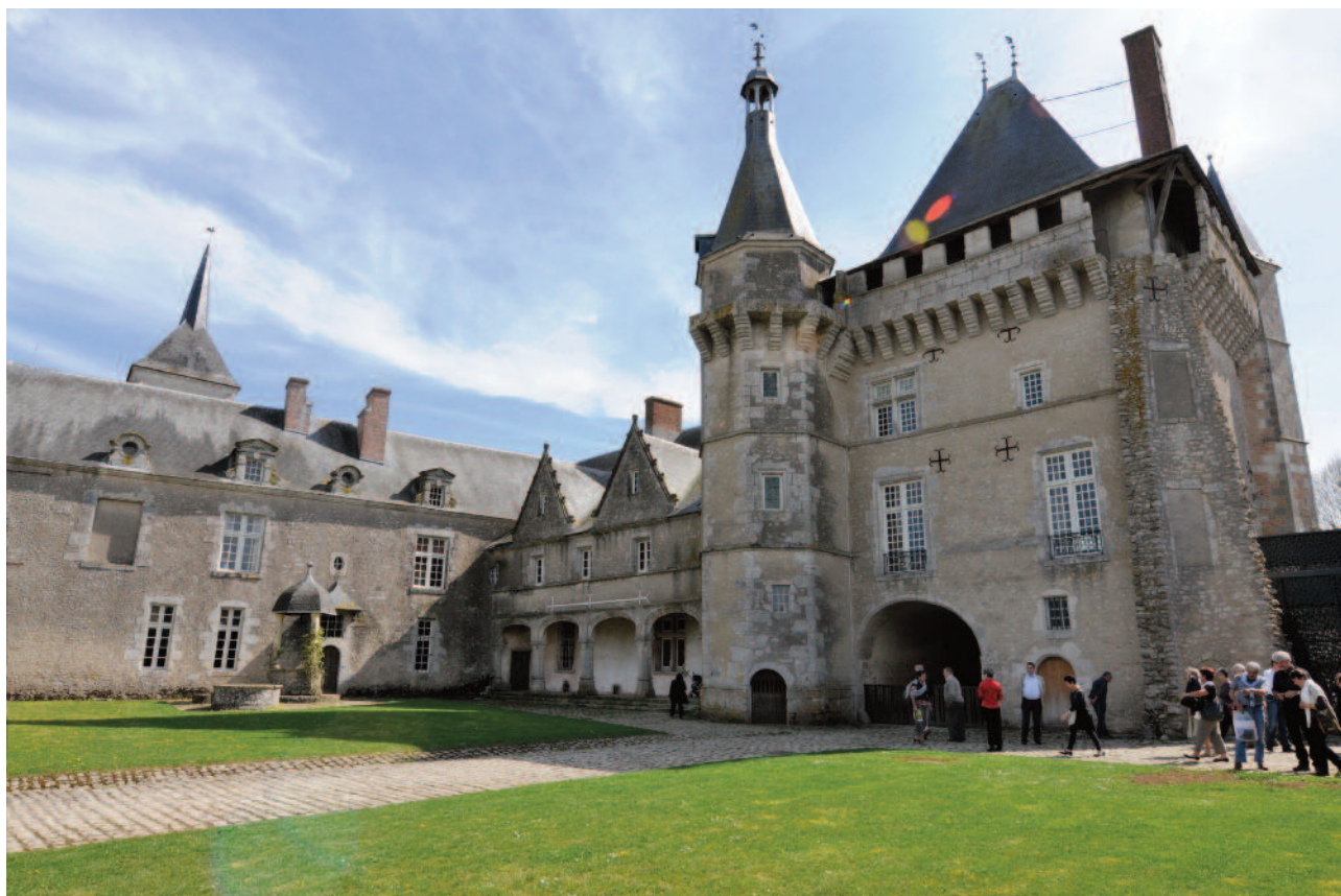
Le château de Talcy, près de Saint-Laurent-Nouan