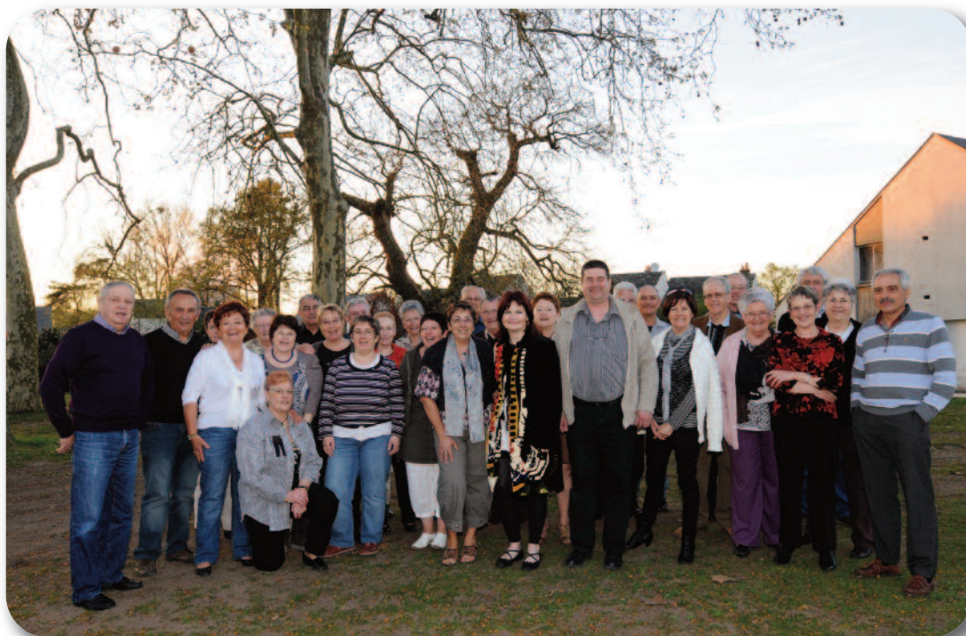
Autour du conseil d'administration, l'équipe de l'association locale St. Laurent 2000, vous attend les 15 - 16 et 17 juillet 2011 pour vous accueillir le plus chaleureusement possible. À bientôt.