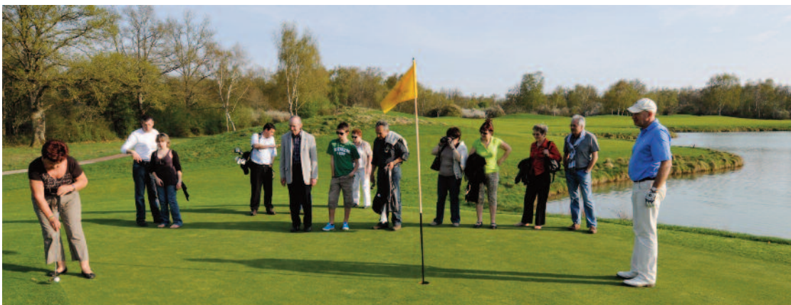
Une visite du domaine était organisée avec pour certains la découverte et la pratique du golf