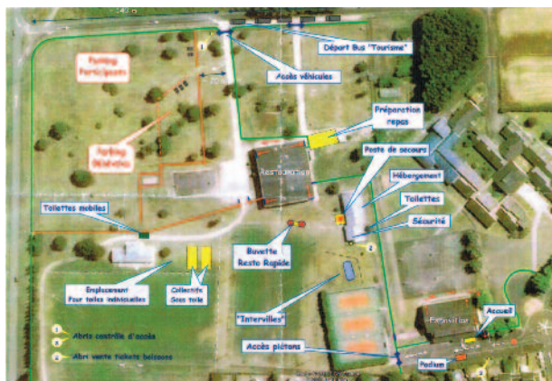
Plan de masse du site du rassemblement 2011

Il est rappelé que les délégations devront amener leurs panneaux signalétiques pour le défilé. Un marché des produits spécifiques à chaque Saint-Laurent sera organisé en juin par l'enseigne Super U de Saint-Laurent-Nouan. Les communes intéressées prendront contact avec Jean-Pierre Lapeyre avant fin mai