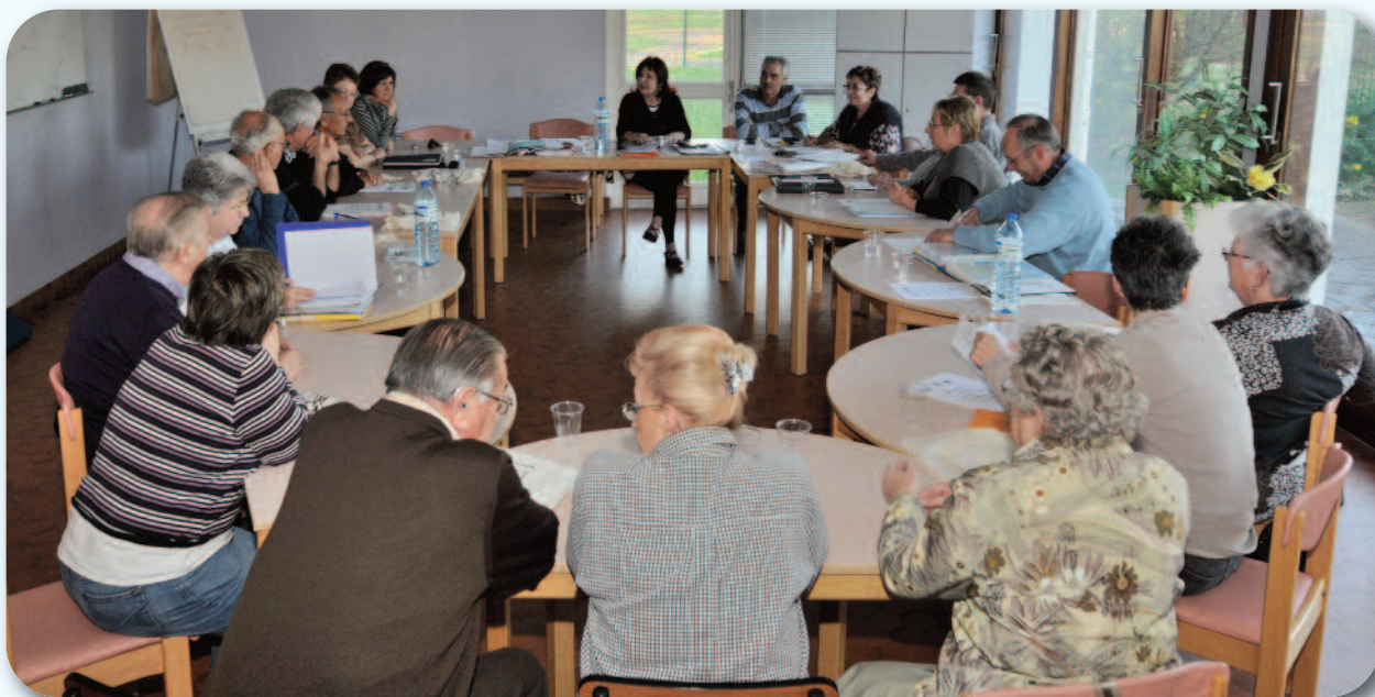
La réunion du conseil d'administration et l'Association locale St. Laurent 2000

Les échanges d'informations et le travail qui a été réalisé dans une ambiance conviviale laissaient planer un avant-goût de ce rassemblement, qui se déroulera dans une région dont la qualité de la vie n'est plus à démontrer et dont le patrimoine architectural et touristique en font un joyau national et mondial.