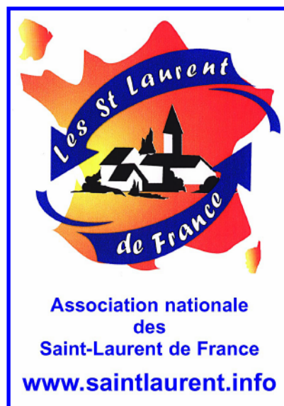
Logo sur auto-collant

Nous ouvrons donc une réflexion parmi nos membres sur ce changement important, ceci afin de prendre position lors de notre assemblée générale extraordinaire de Saint-Laurent-du-Mottay le 24 août prochain.