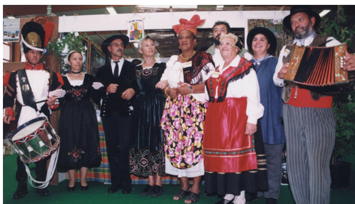
5° grand rassemblement d'août 1998 à SL-des-Autels