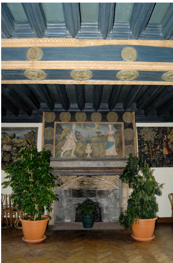
Salle de la mairie, sa cheminée, son plafond

Le plafond est formé de vingt belles solives en chêne, gracieusement cannelées avec au centre une admirable poutre, qui forme saillie, décorée de vingt huit médaillons. Ces médaillons circulaires, inscrits dans de larges « couronnes laurées » témoignent de recherche et d'invention dans le