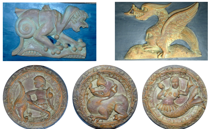
Médaillons de la poutre centrale (sélection)