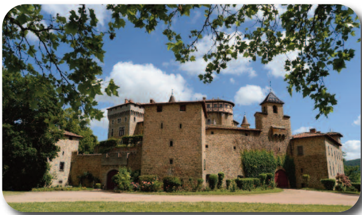
Le château de Chamousset.

Il a été la propriété successive des comtes du Forez, de l'abbaye de Savigny, des familles Saint-Symphorien, Savaron, Saint-Victor. Il a été démoli en 1283, reconstruit un siècle plus tard, puis restauré par l'architecte Duthoit, disciple de Viollet-le-Duc. François 1er y séjourna vers 1530 et, en dédommagement des frais occasionnés, accorda le privilège de construire dans le village une halle pour abriter foires et marchés. Pendant la dernière guerre, le comte et la comtesse de Saint-Victor mirent le château à la disposition des résistants dirigés par le colonel Mary-Basset. C'est là qu'a été organisée la libération de Lyon. Le château est inscrit à l'inventaire supplémentaire des monuments historiques.