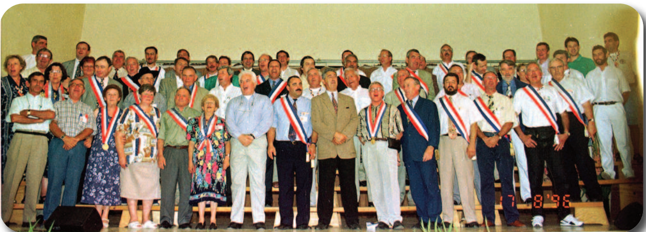
Ce n'est juste que 20 ans en arrière. C'était un certain 17 août 1996.

L'affiche et la vidéo du 26 o rassemblement seront disponibles sur demande.