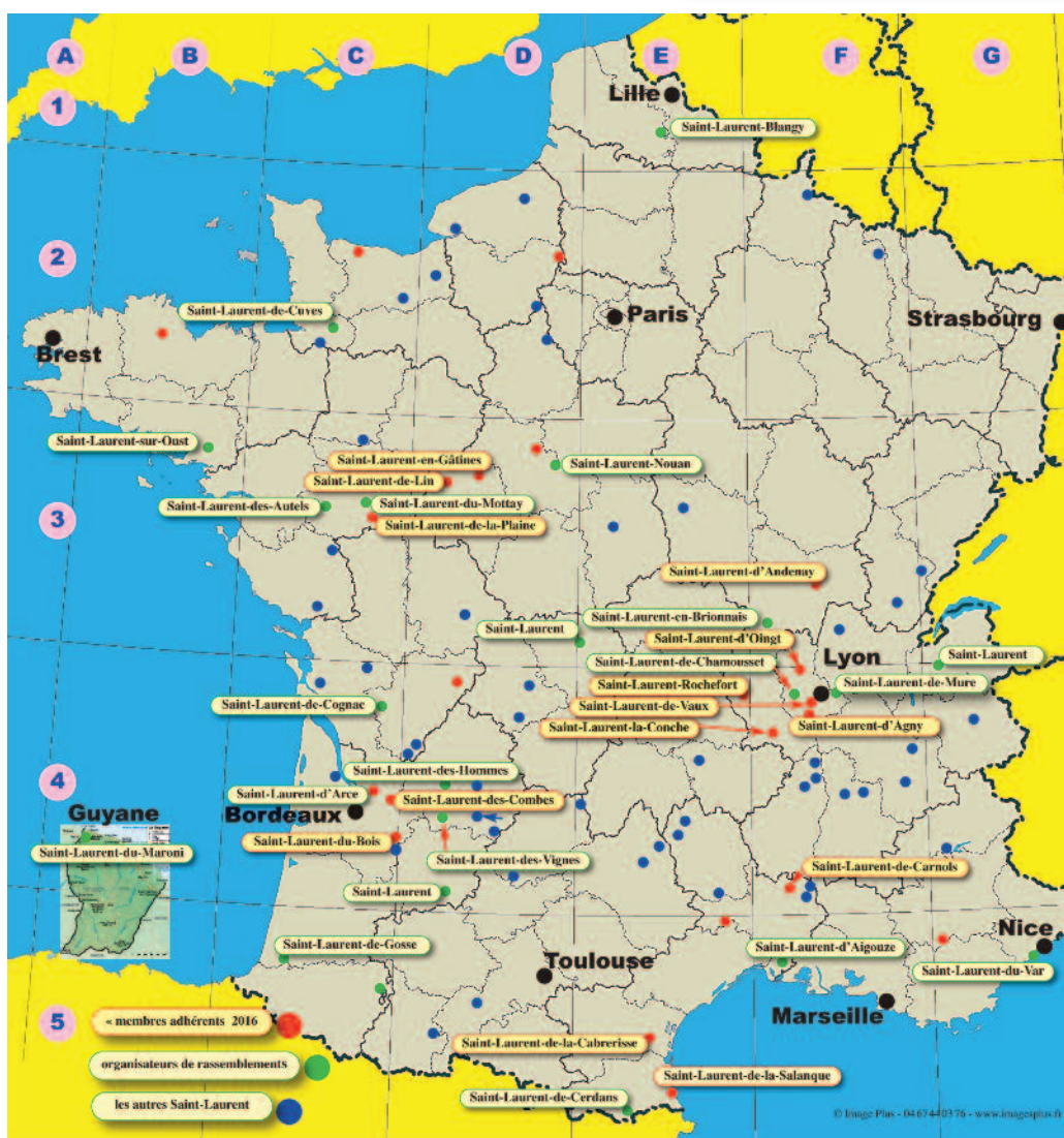
Délégations présentes au 26° rassemblement