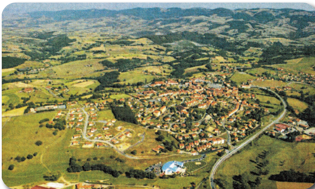
Vue aérienne de Saint-Laurent-de-Chamousset au premier plan Escap'ad

Située sur la propriété du château de Chamoussset, au lieu-dit « Tramoye », cette porte du XVI e siècle fut démontée de l'ancienne église du village de Brullioles à la fin du XIX e siècle et remontée en pleine nature car la famille de Saint Victor, qui en avait financé la construction, a demandé à la récupérer sur ses terres. Elle est inscrite à l'inventaire supplémentaire des monuments historiques.