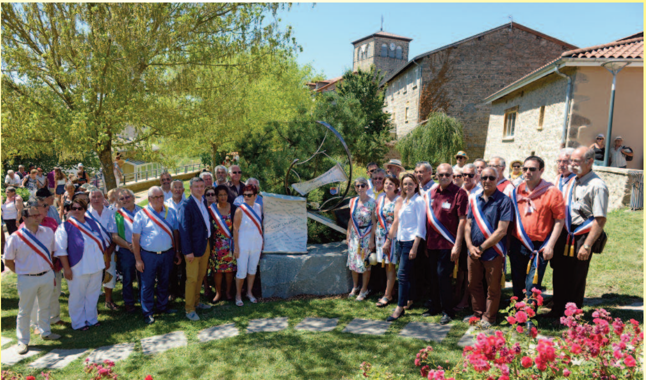
Inauguration du monument des Saint-Laurent le 10 juillet 2016 à Saint-Laurent-de-Chamousset

N° 53 - octobre 2016 www.saintlaurent.info