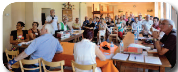
Assemblée générale du 17 juillet 2016.

Les réponses apportées aux questions 1 - 2 et 3, présentées à l'assemblée générale, n'ont pas fait l'objet d'intervention. Ainsi les décisions entérinées lors des assemblées générales précédentes restent pérennes.