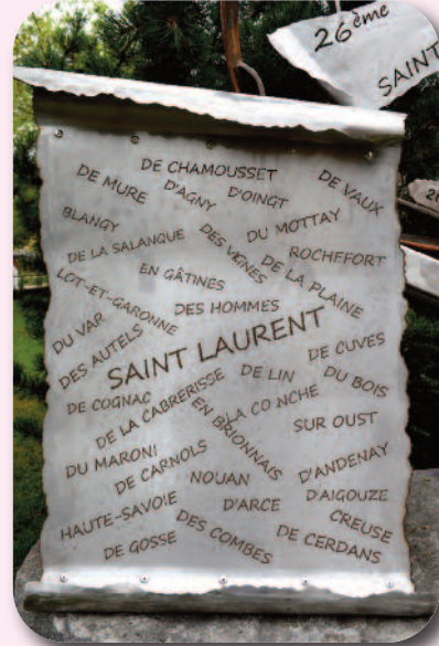
Monument inauguré le 17 juillet 2016 avec les noms des 35 délégations présentes au 26 o rassemblement

Saint-Laurent (en Creuse) (23) Saint-Laurent (en Gascogne) (47) Saint-Laurent (en Haute-Savoie) (74) Saint-Laurent-Blangy (62) Saint-Laurent-d'Agnay (69) Saint-Laurent-d'Andenay (71) Saint-Laurent-d'Arce (33) Saint-Laurent-d'Aigouze (30) Saint-Laurent-de-Carnols (30) Saint-Laurent-de-Cerdans (66) Saint-Laurent-de-Chamousset (69) Saint-Laurent-de-Cognac (16) Saint-Laurent-de-Cuves (50) Saint-Laurent-de-Gosse (40) Saint-Laurent-de-la-Cabrèrresse (11) Saint-Laurent-de-la-Plaine (49) Saint-Laurent-de-la-Salanque (66)