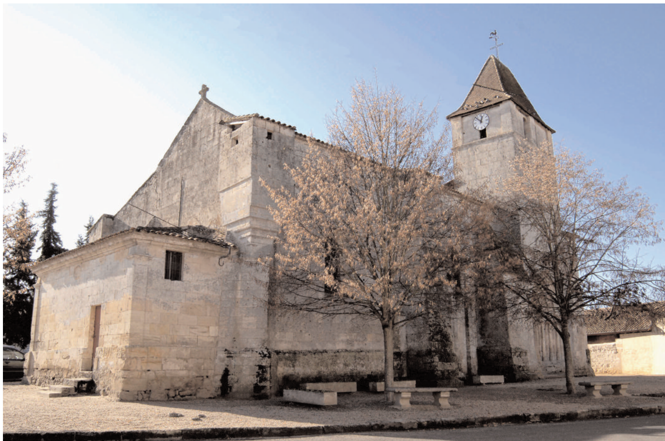
Eglise de Saint-Laurent-d'Arce XIII e siècle

N°27-décembre 2007 www.saintlaurent.info