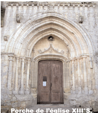
Porche de l'église XIII° S.

En 1453, toutes ces défenses furent mises à mal lors de l'invasion des Français. Mais avant cet épisode historique, la réputation de ce « péis » était bien connue des pèlerins allant vers Saint-Jacques-de-Compostelle. Les « Templiers », puis les « Hospitaliers de Saint-Jean », dont il ne subsiste comme traces que la chapelle de Magrigne, assuraient à la fois gîte, nourriture temporelle et nourriture spirituelle.