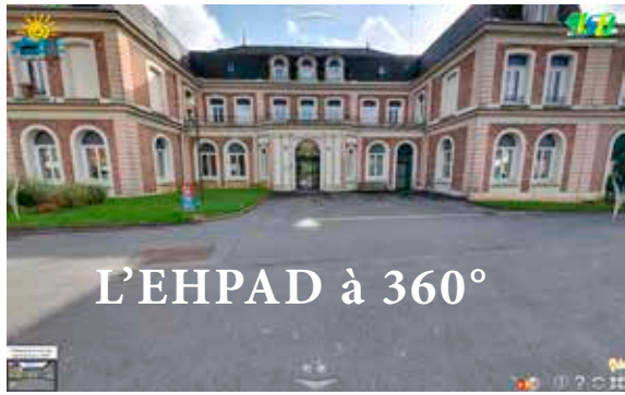
L'EHPAD à 360°