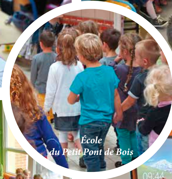
École du Petit Pont de Bois