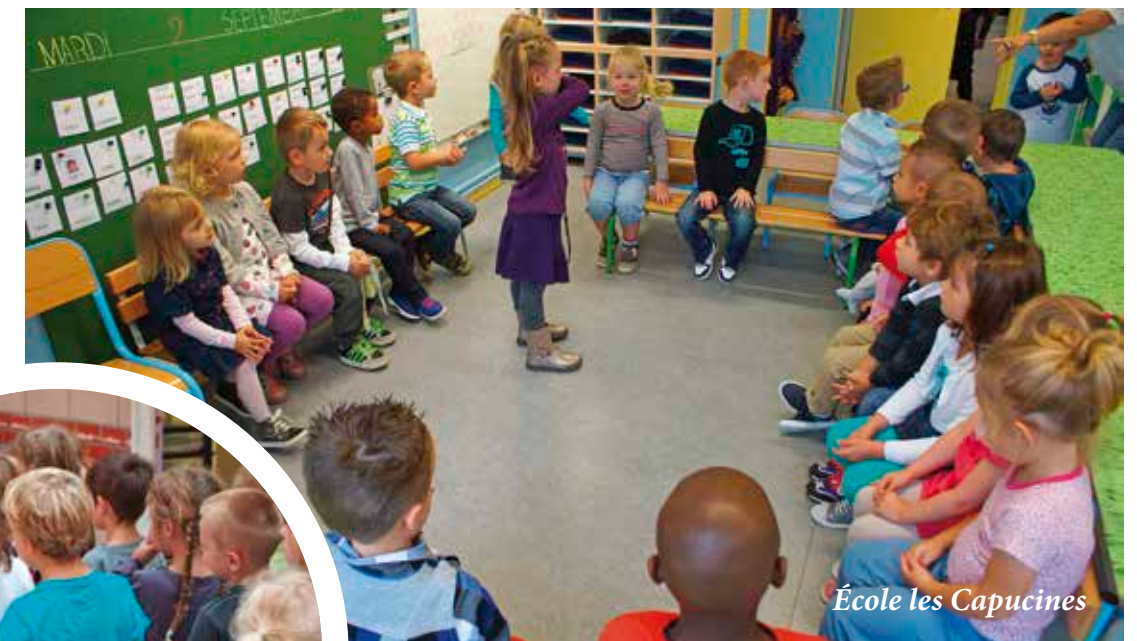
École les Capucines

Nous sommes également la seule municipalité de la CUA à avoir mis en place les coupons « coup de pouce » pour être plus sport ! une opération renouvelée cette année pour les enfants Immercuriens nés entre 1998 à 2010 afin de faciliter l'accès aux activités culturelles et sportives proposées par les diverses structures associatives communales.