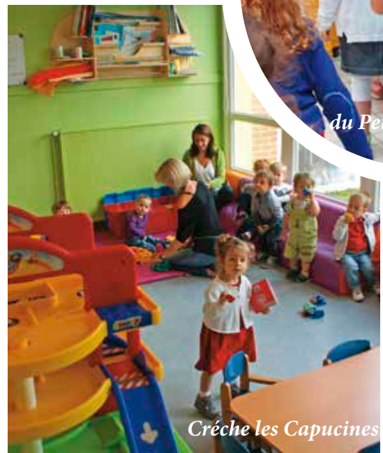
Crèche les Capucines