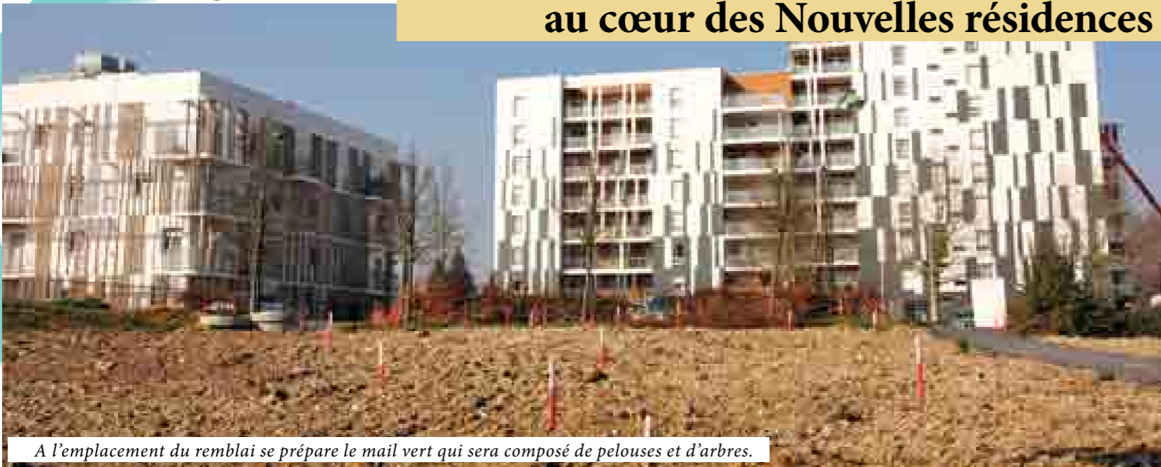
A l'emplacement du remblai se prépare le mail vert qui sera composé de pelouses et d'arbres.

Tandis que les travaux de finition du rond-point de l'avenue Raoul Thibaut s'achèvent, les travaux du parking jouxtant le centre médical commencent. Ils dureront jusque l'été. Pour rappel, un parking provisoire a été aménagé par la Ville en contrebas de la pharmacie pour permettre aux clients de stationner.