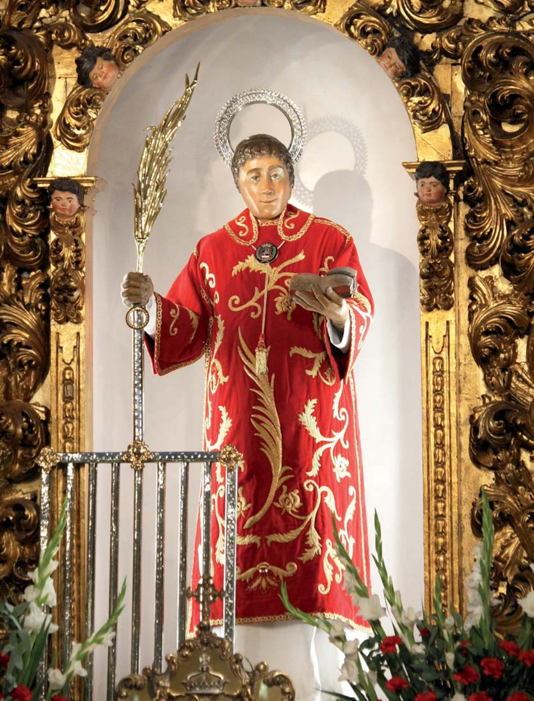
SAN LORENZO EN SU CAPILLA Real y Parroquial Basílica de San Lorenzo, Huesca