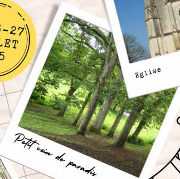
Petit coin de paradis