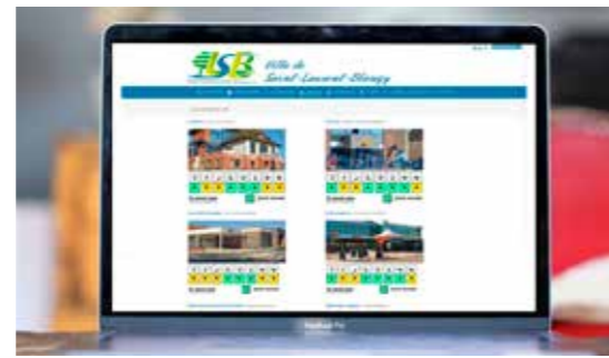
La Mairie - rue Laurent Gers

L'information d'accessibilité est désormais inclusive, car accessible à tous sans exception, de manière simple, efficace, mais surtout rassurante pour les personnes handicapées, qu'elles soient handicapées physiques, malvoyantes, sourdes ou malentendantes.