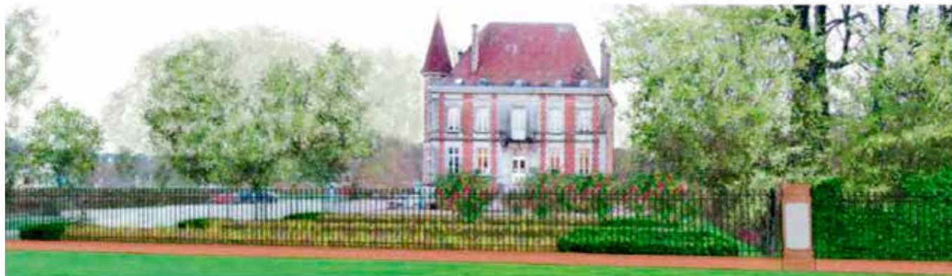
Vue finale depuis la rue Laurent Gers une fois le bassin d'orage totalement finalisé