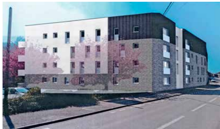
Saint-Laurent-Blangy : un parcours résidentiel adapté pour chacun.