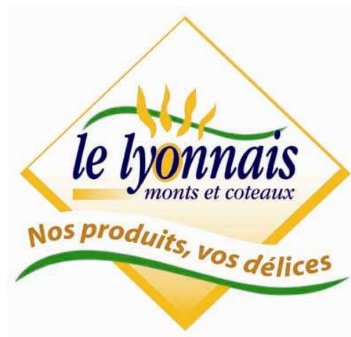
Le logo de la Marque « Le Lyonnais Monts et Coteaux »