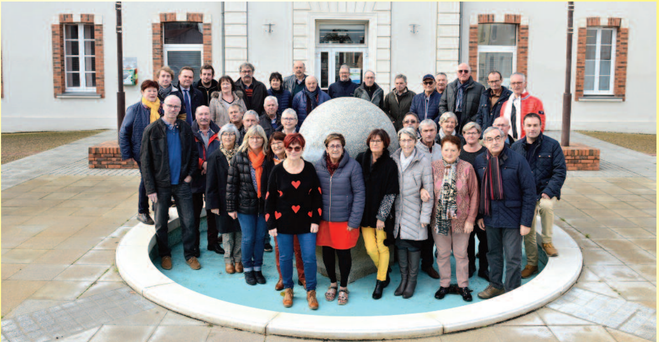
Saint-Laurent-des-Autels - Les membres du conseil d'administration et l'équipe de l'association locale