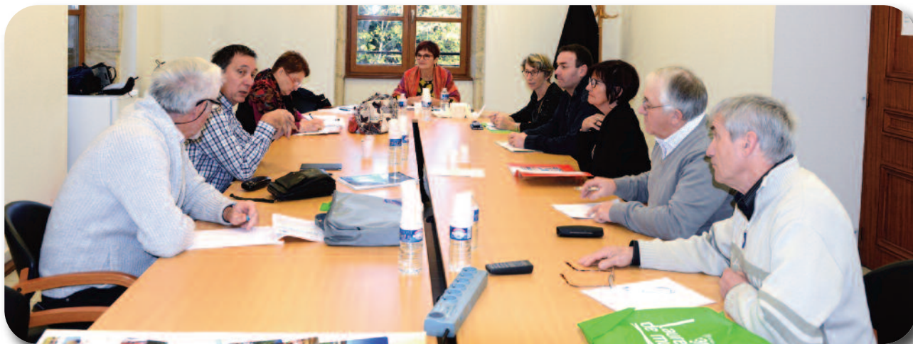
Les membres du conseil d'administration en séance de travail

Présidente de l'Association nationale des Saint-Laurent de France