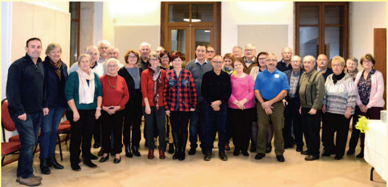
Les membres du conseil d'administration et l'équipe de l'association locale

N° 59 - janvier 2019 www.saintlaurent.info