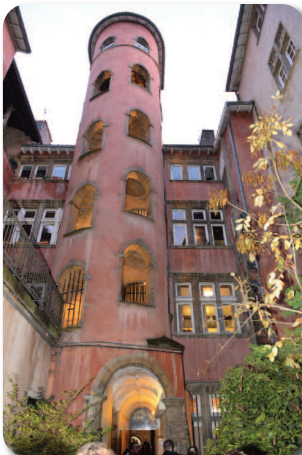
La Tour rose