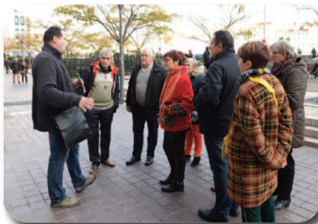
Visite du vieux Lyon.