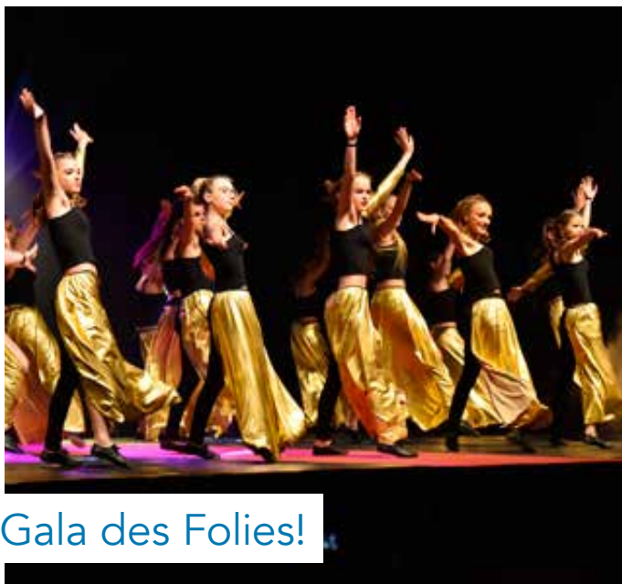
Gala des Folies!